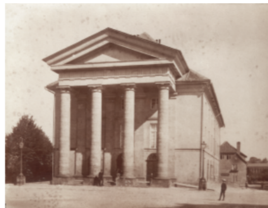
“Altes” Hoftheater, erbaut 1825, eröffnet am 8. November 1825 mit Mozarts “Titus”

Das seit September 2014 am Musikwissenschaftlichen Seminar Detmold/Paderborn laufende DFG-Projekt „Entwicklung eines MEI- und TEI-basierten Modells kontextueller Tiefenerschließung von Musikalienbeständen am Beispiel des Detmolder Hoftheaters im 19. Jahrhundert (1825–1875)“ setzt sich erstmals im Detail mit den überlieferten Quellen aus der Blütezeit des Detmolder Hoftheaters auseinander. Dazu zählen neben den in der Lippischen Landesbibliothek Detmold verwahrten historischen Aufführungsmaterialien und Aktenbeständen ergänzende Materialien aus dem Landesarchiv NRW, Abteilung Ostwestfalen-Lippe (Personalakten etc.) und dem Staatsarchiv Osnabrück (Theaterzettel).